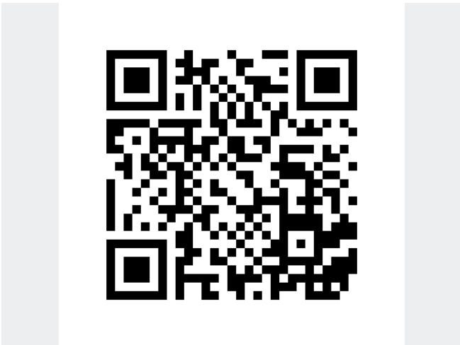
QR Code zum Rundgang