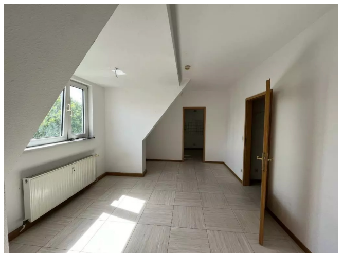
Wohnzimmer Ansicht 2