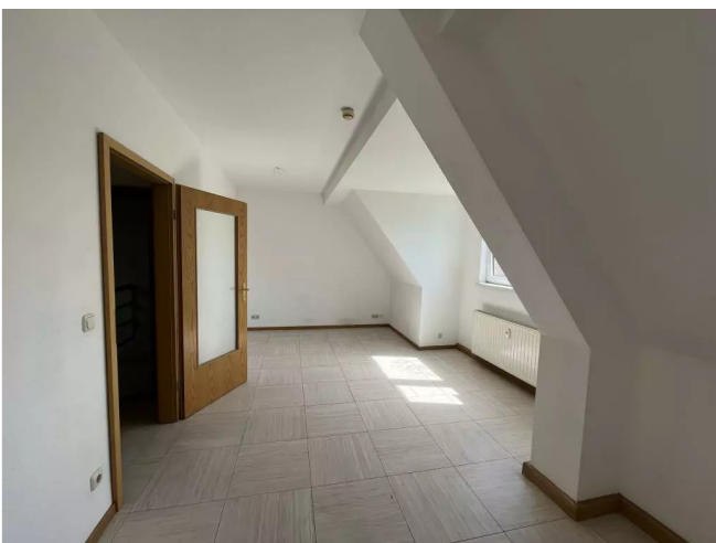
Wohnzimmer Ansicht 1