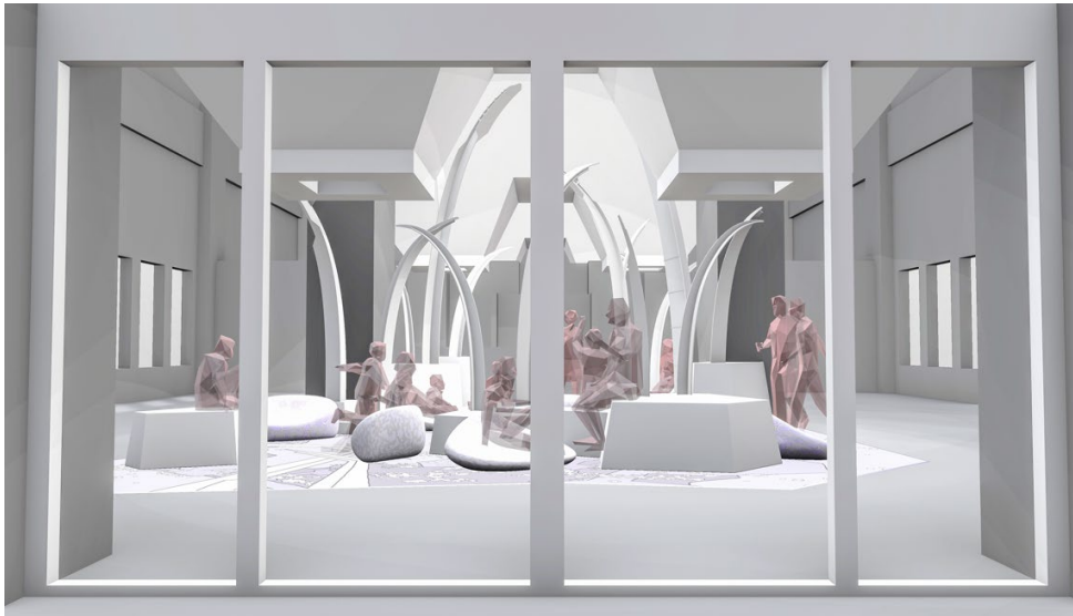
Weißmodell „Myrmekadia“ im 3D-Rendering: Blick aus dem Vorraum des Greentower im EG