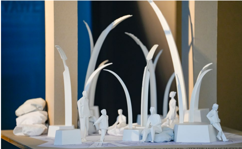
Plastisches Weißmodell „Myrmekadia“ von Valerie Buchow und Johannes Leidenberger; Foto: © VIVAWEST