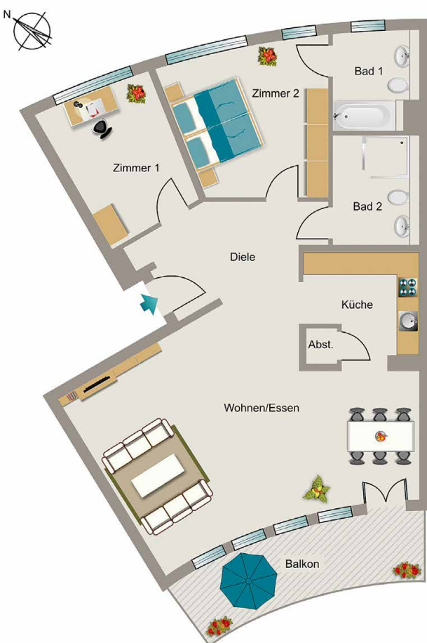
Beispielgrundriss | 3-Zimmer Wohnung (Planungsstand April 2015)