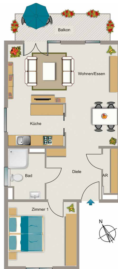
Beispielgrundriss | 2-Zimmer Wohnung (Planungsstand April 2015)