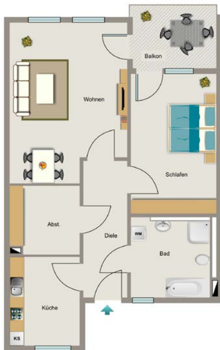
Beispiel 2,5-Raum-Wohnung mit 66 m 2

Nur wenige Kilometer vom Wohnquartier entfernt befindet sich der Anschluss an die Autobahn A2. Zudem ist Alt-Scharnhorst über die Bundesstraße B236 zentral erschlossen und optimal an den öffentlichen Nahverkehr angebunden.