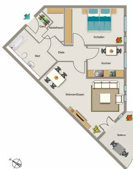
Beispiel 2,5-Raum-Wohnung mit 77 m 2