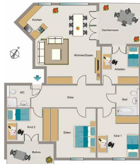
Beispiel 5,5-Raum-Wohnung mit 150 m 2