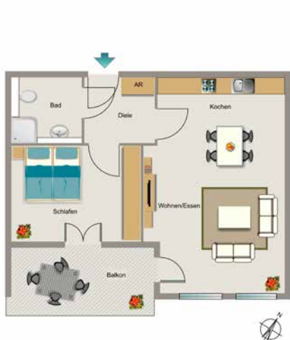
Beispiel 2,5-Raum-Wohnung mit 59 m 2

Sollten Sie eine kulturelle Abwechslung suchen, erwarten Sie innerhalb der Kunsthalle Recklinghausen unterschiedliche Ausstellungen und Vernissagen. Auch das Ruhrfestspielhaus ist eine beliebte Location für das kulturelle Leben in Recklinghausen, das inmitten der grünen Idylle des Stadtgartens liegt.