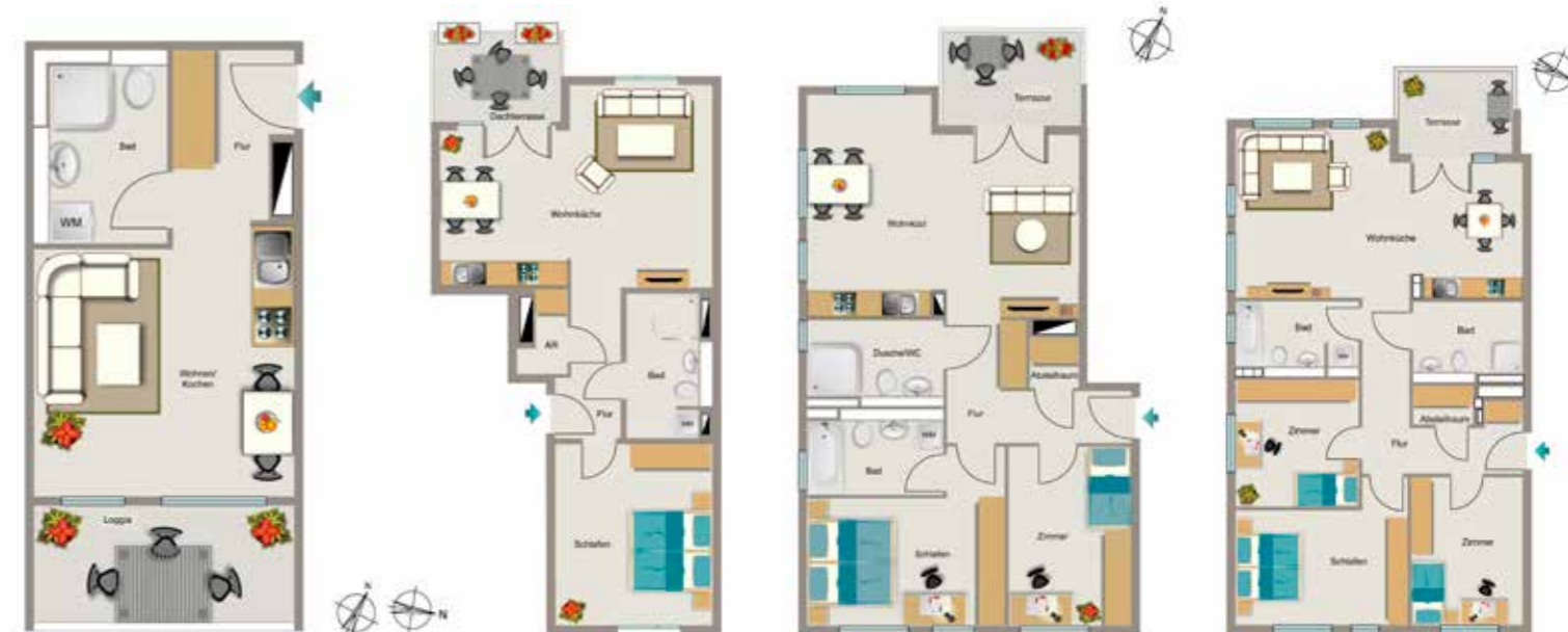
Beispiel 1,5-Zimmer-Wohnung mit ca. 27,33m 2

Badewanne und eine Video-Gegensprechanlage. Bis auf wenige Ausnahmen verfügen alle Wohnungen über einen Balkon, eine Terrasse oder Dachterrasse. Die Aufzugsanlage ermöglicht einen stufenlosen Zugang zu allen Wohnungen und Kellerräumen. Für eine entspannte Parksituation sorgen 171 Plätze in der Tiefgarage und 37 Außenstellplätze.