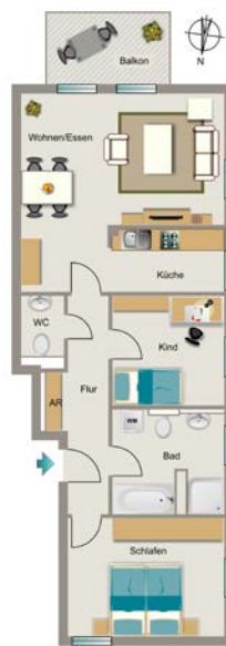
Beispiel 3,5-Raum-Wohnung mit 85 m 2