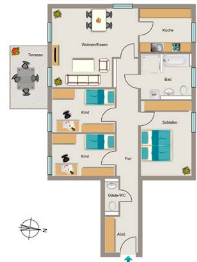
Beispiel 4,5-Raum-Wohnung mit 102 m 2