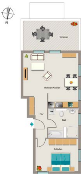
Beispiel 2,5-Raum-Wohnung mit 71 m 2

Nord, zu erreichen. Unmittelbar am Wohnquartier befindet sich eine Bushaltestelle mit Verbindung in die Innenstadt und zu dem Hauptbahnhof sowie zu weiteren Zielen im Stadtgebiet. Durch den Anschluss an die Bundesstraße B54 mit direkter Verbindung an die Autobahn A1 und durch die Bundesstraßen B219 ist der Münsteraner Stadtteil Kinderhaus zentral erschlossen. So sind Sie optimal an die angrenzenden und weiter entfernten Regionen angebunden.