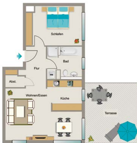
Beispiel 2-Raum-Wohnung mit 69,9 m 2