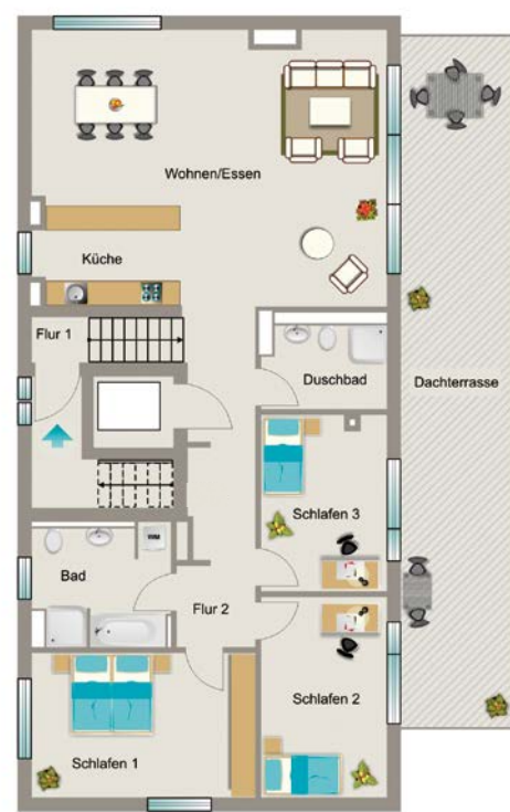
Beispiel Penthouse-Wohnung mit 129,4 m 2