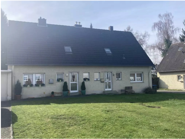
Fortunastr. 66 und 68