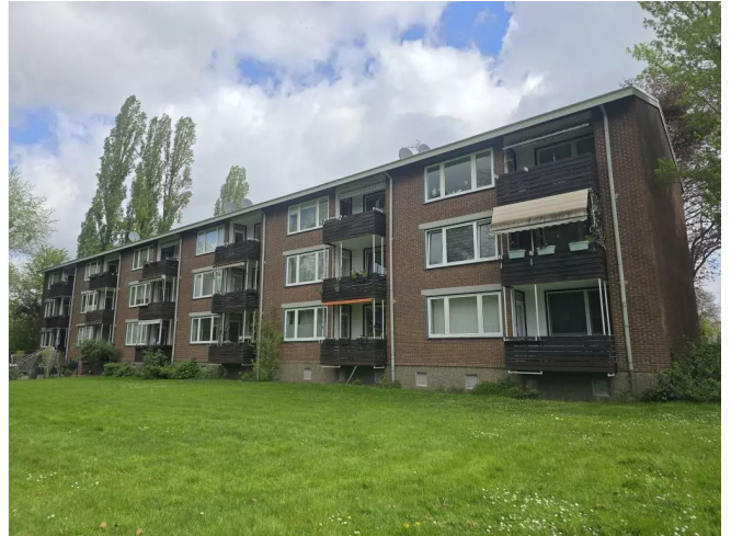
Boschstr. 61-63 hinten