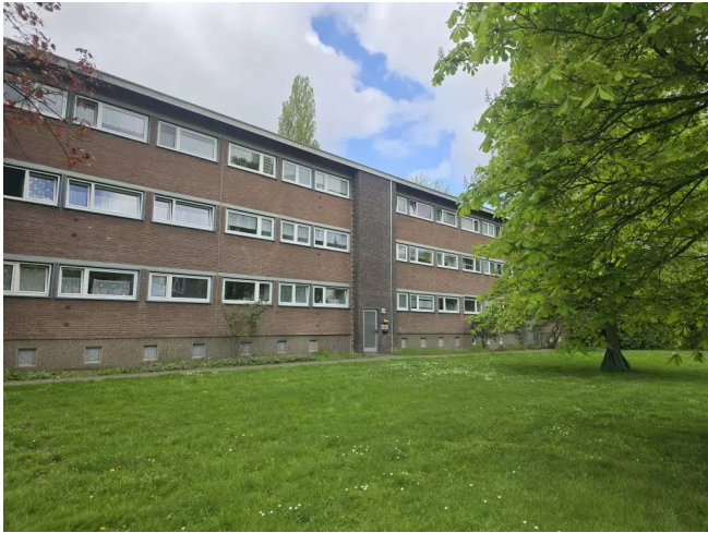
Boschstr. 63 vorne