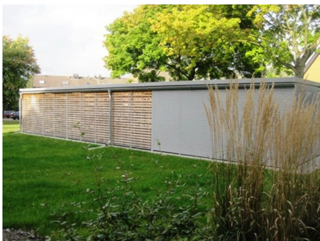
Fahrradbox & Mülltonnenstandpl