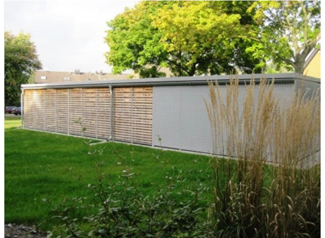
Fahrrad- u. Müllstellplatz