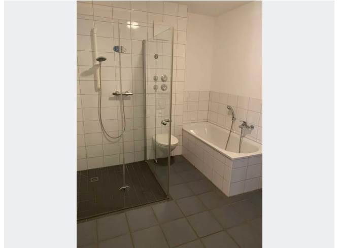
Bad - Muster