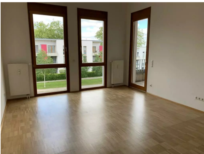
Wohnzimmer - Muster