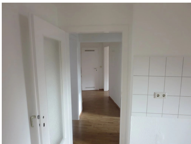
Diele (ohne Oberboden)