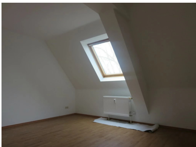
Schlafzimmer (ohne Oberboden)