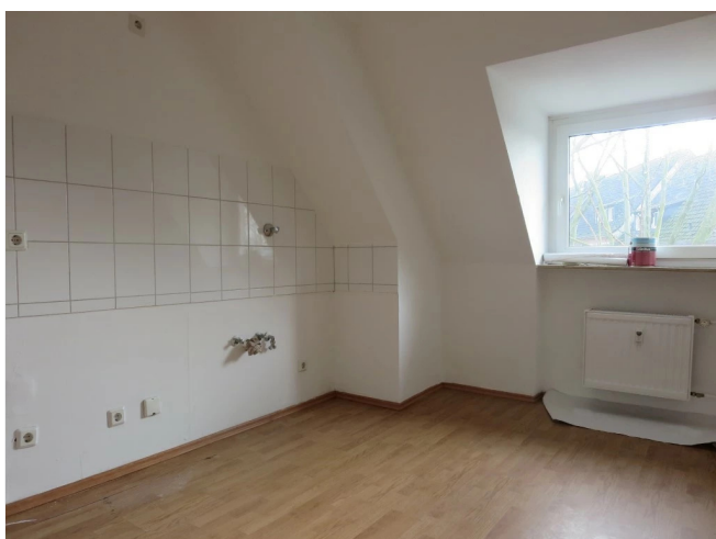
Küche (ohne Oberboden+Fliesen)