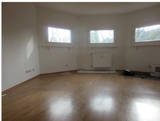
Wohnzimmer (ohne Oberboden)