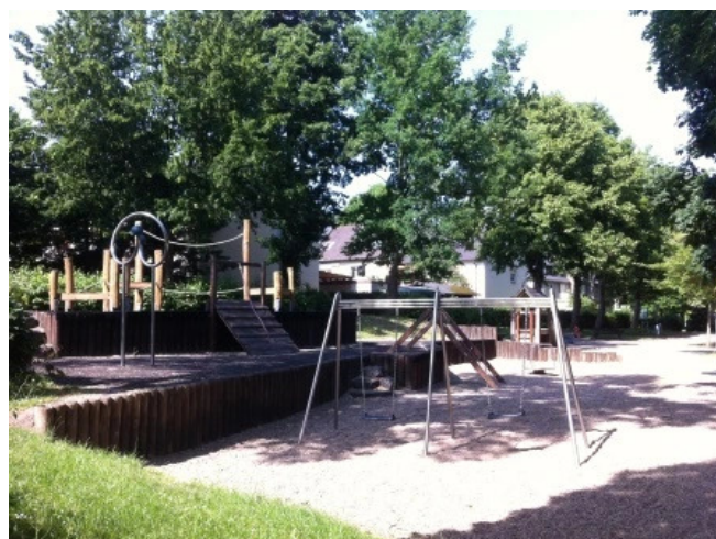
Spielplatz in der Nähe