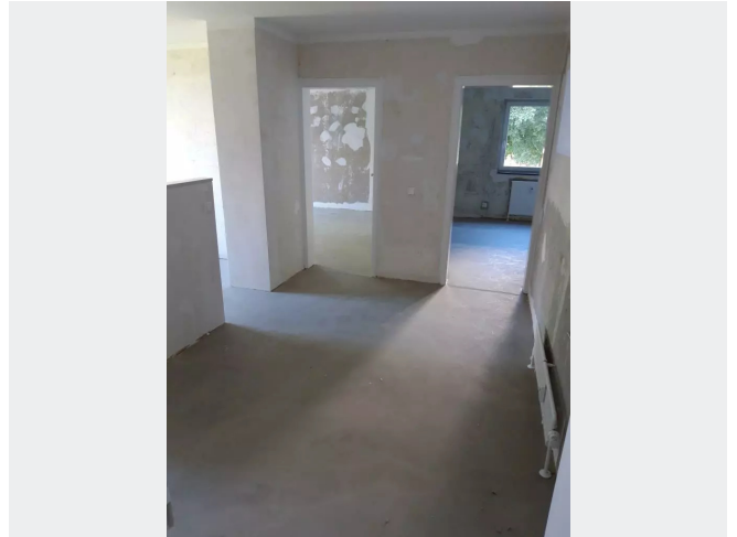
Flur mit offener Küche (Bsp)