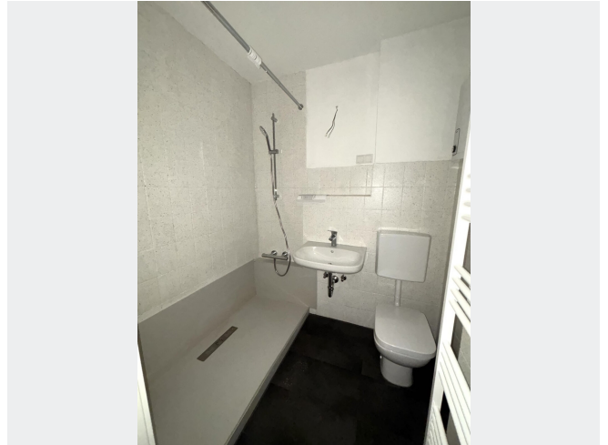
Badezimmer mit Dusche