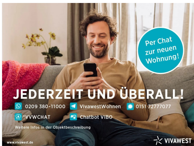
Kontakt per Messenger!