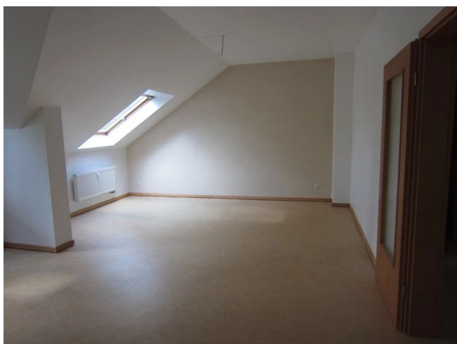
Wohnzimmer vor Teilung