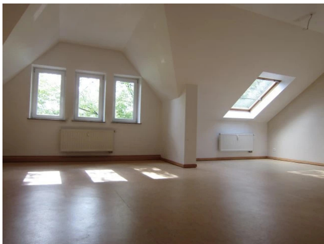
Wohnzimmer vor Teilung