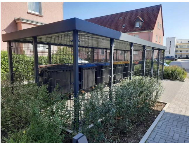
Müllplatz neben dem Haus