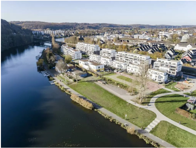
Wohnen in Ruhrnähe - Essen-Ket