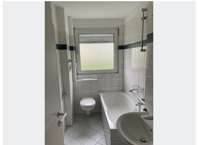
Stegemannsweg 50, EG rechts