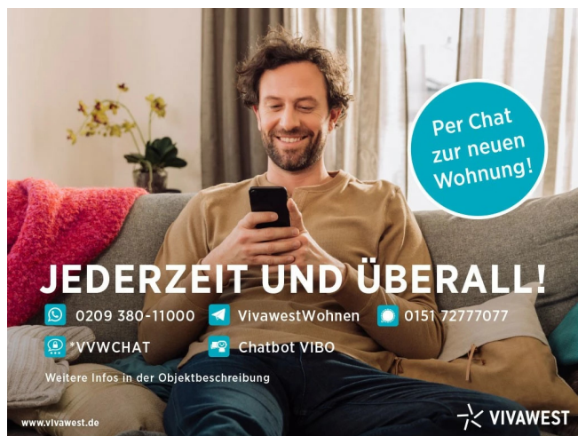
Bild Messenger Internetanzeige