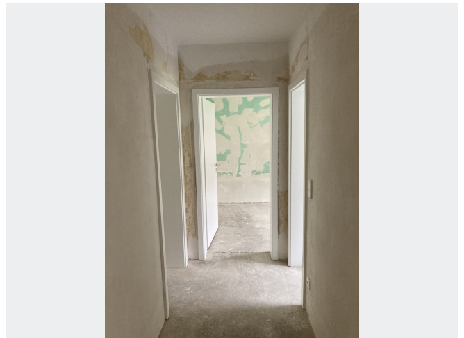
Flur 7 Diele Beispielhaft