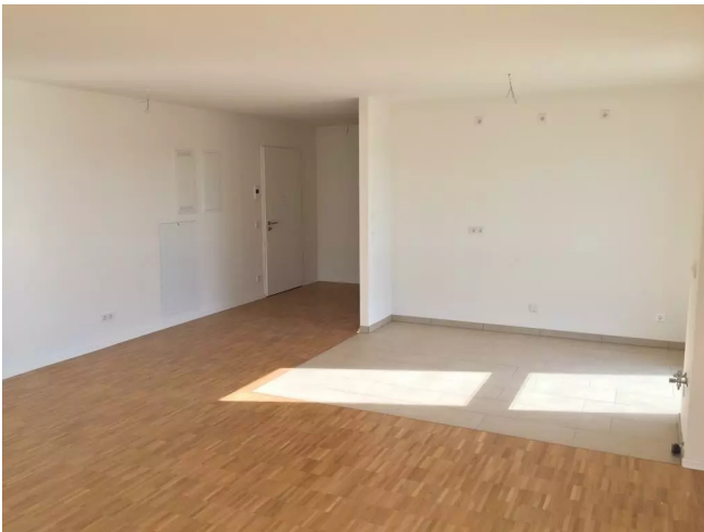
Küche mit Wohnbereich