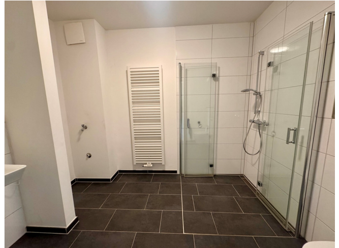
Badezimmer mit Dusche ähnlich