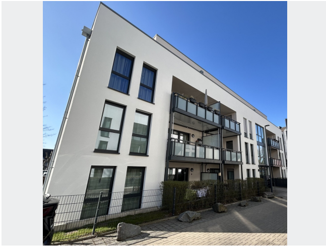
Auf der Bicke 3