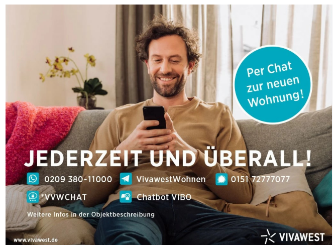
Kontakt per Messenger!