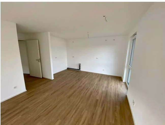
Koch- und Essbereich