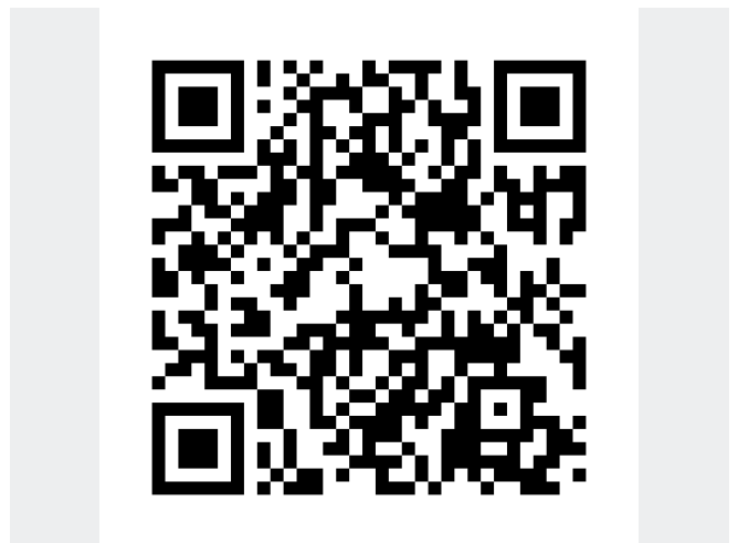
QRCODE 360 Grad Begehung