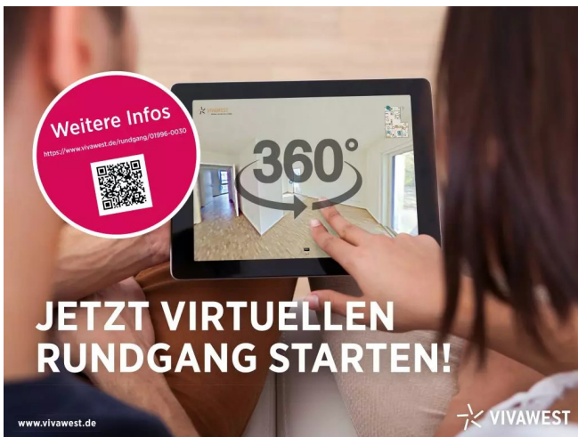
360 Grad Begehung