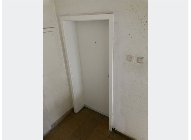
Zugang zur Wohnung