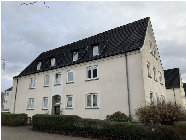
Am Heikenberg 12