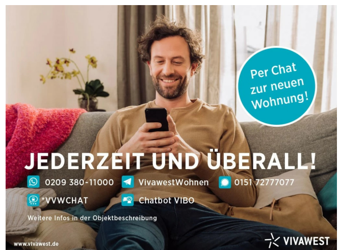
Bild Messenger Internetanzeige