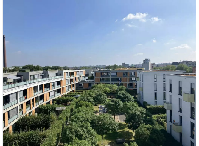
Ausblick Pier 78