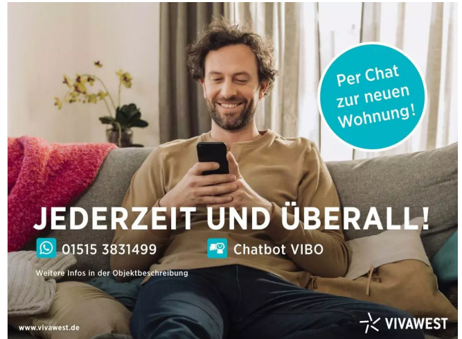
Kontakt per Messenger!