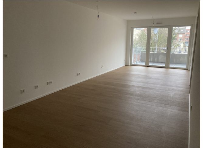
Wohnzimmer mit offener Küche