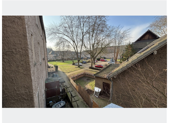
Aussicht in den Hinterhof