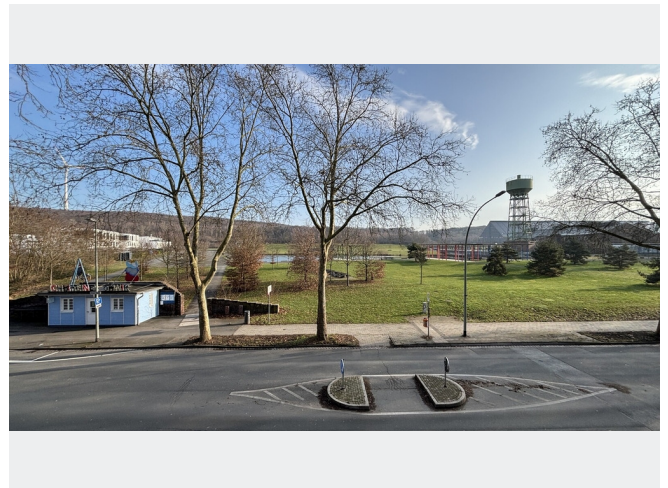
Aussicht auf den Bergpark