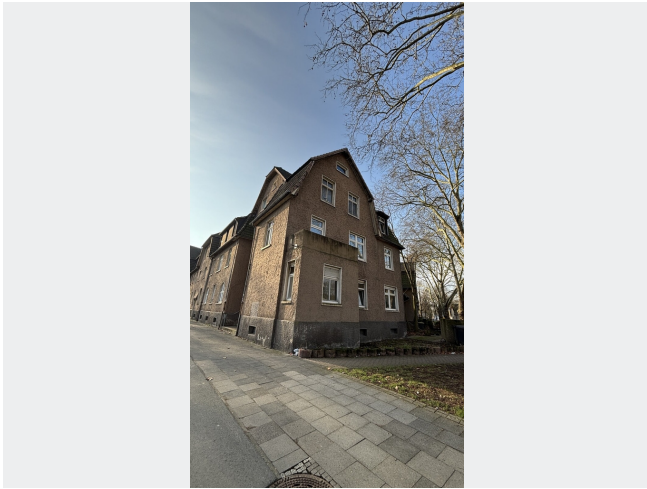
Hünxer Str. 419