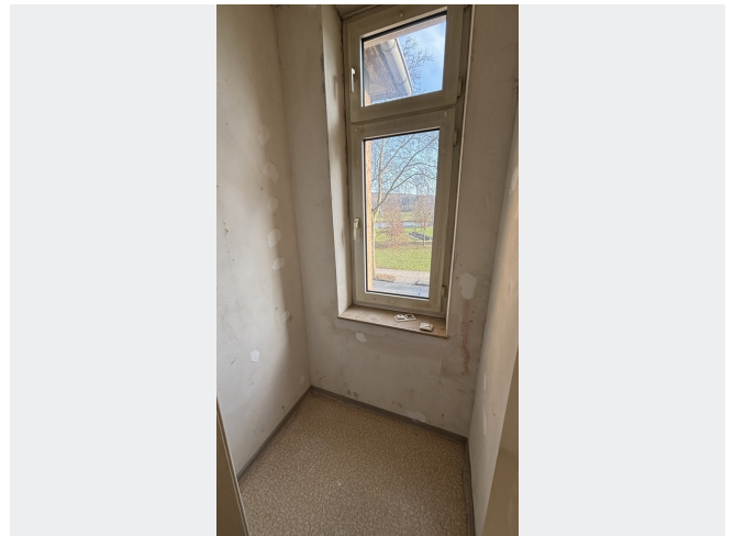
Abstellkammer mit Fenster