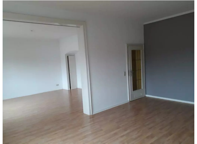
Wohn-Essbereich (ohne Laminat)