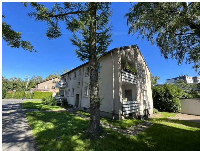
Talstr. 50 Seitenansicht