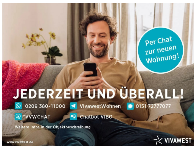
Bild Messenger Internetanzeige