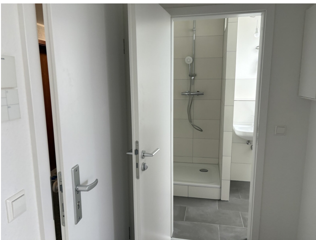
Diese Blick auf Badezimmer