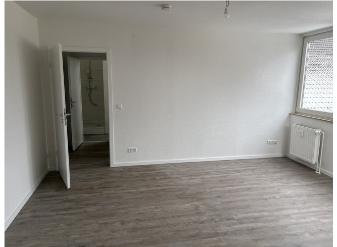
Wohn und Schlafzimmer