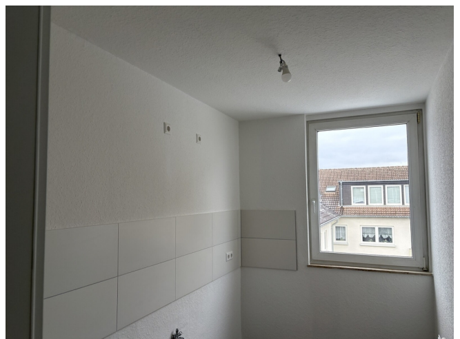
Haus Baden Kerpen ME 309