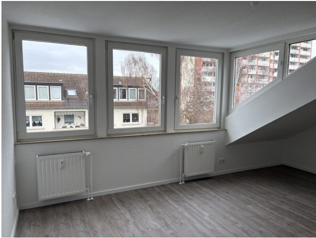
Wohn und Schlafzimmer