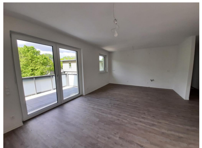
Küche mit Wohn- Esszimmer