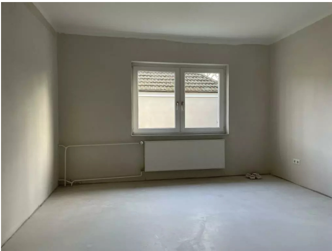
Schlafzimmer Größe Beispiel