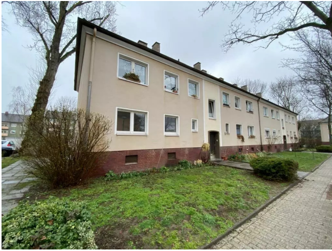
Hausansicht vor Modernisierung