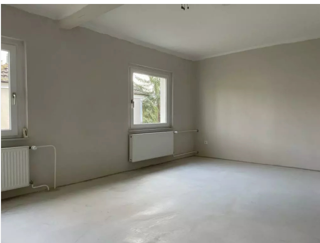
Wohnzimmer Größe Beispiel