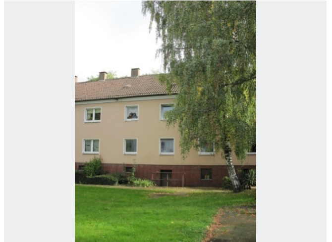
Am Witrahm 9 Hinteransicht