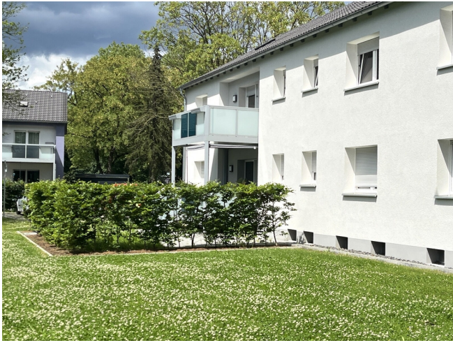
Knappenstr. 2 Terrassenbereich