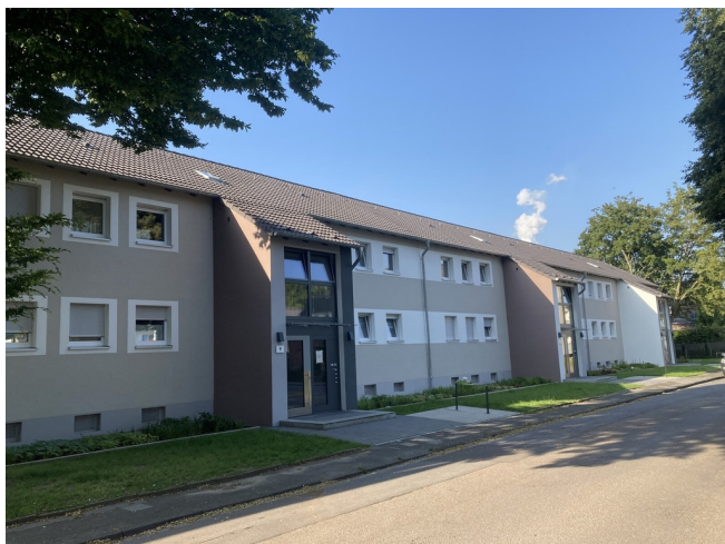
Im Bremlenkamp 9-13