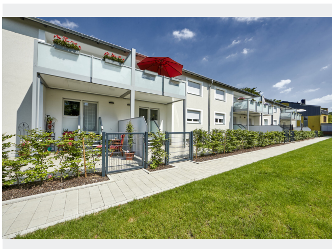
Im Bremlenkamp 9-13