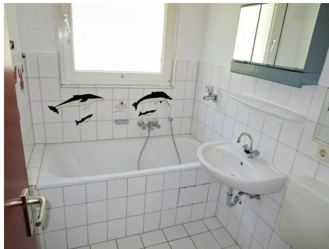
Bad hell gefliest