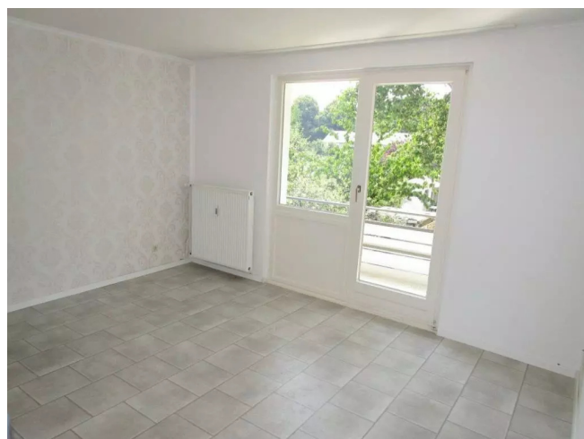
Wohnzimmer Ansicht 1