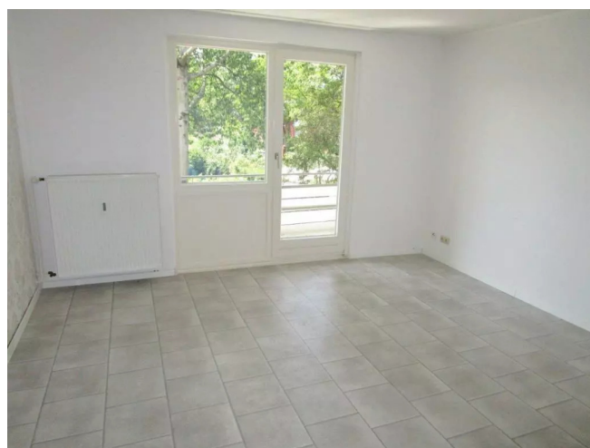
Wohnzimmer Ansicht 2