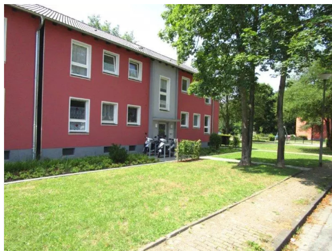
Horstweg 25-Ansicht 2