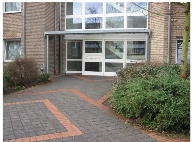
Ebenerdiger und weitläufiger E