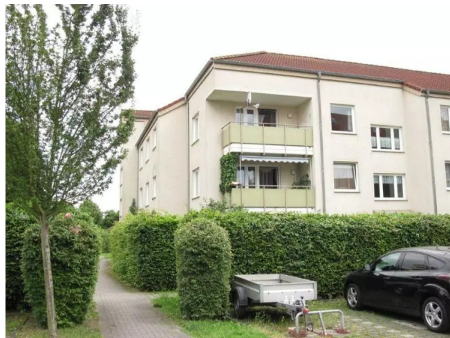
Stellplätze am Haus