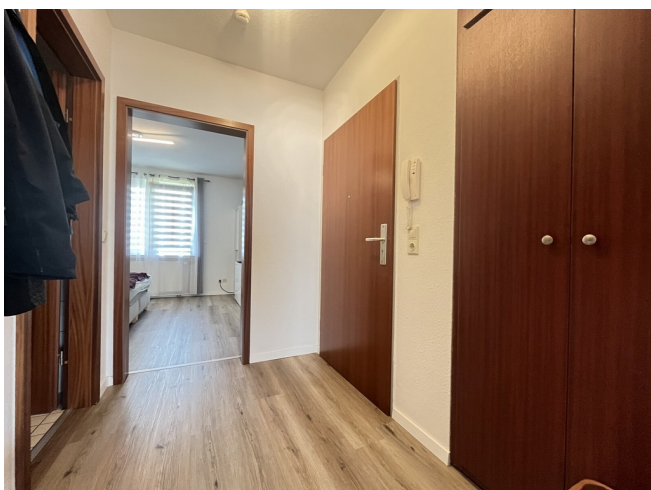
Diele mit Wandschrank