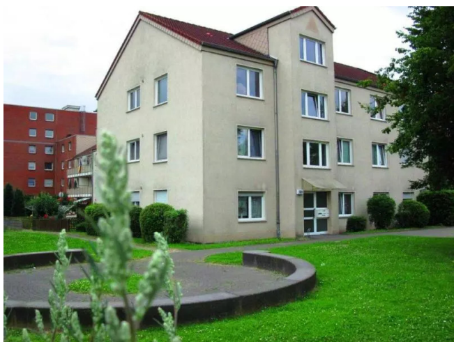
Teichacker 10 a