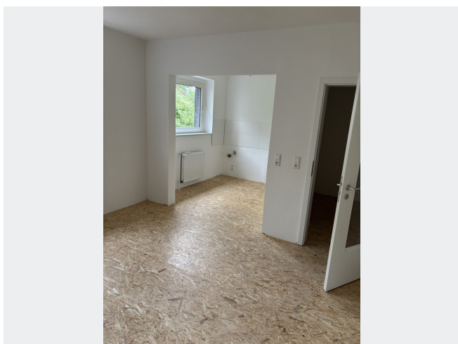
offene Küche zum Wohnzimmer