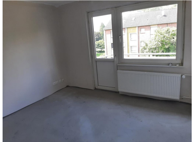
Wohnzimmer - Beispielansicht