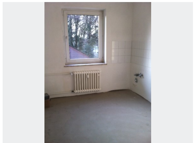
Küche - Beispielansicht