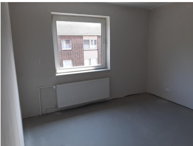
Schlafzimmer - Beispielansicht