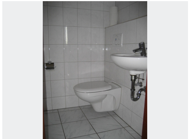
Beispiel WC Raum