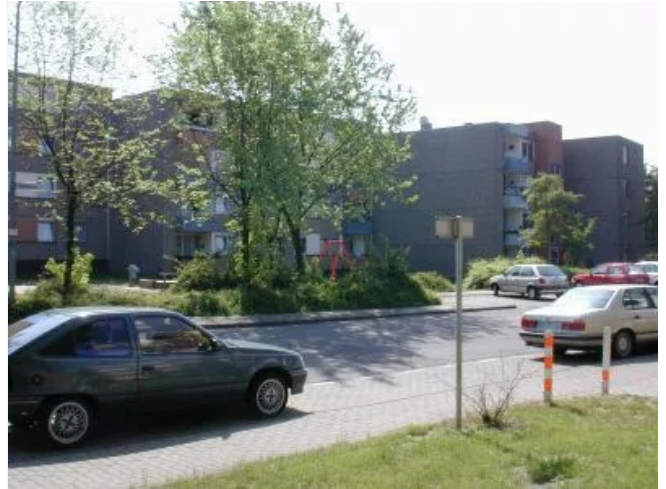
Sternstr. 57 Rückfront