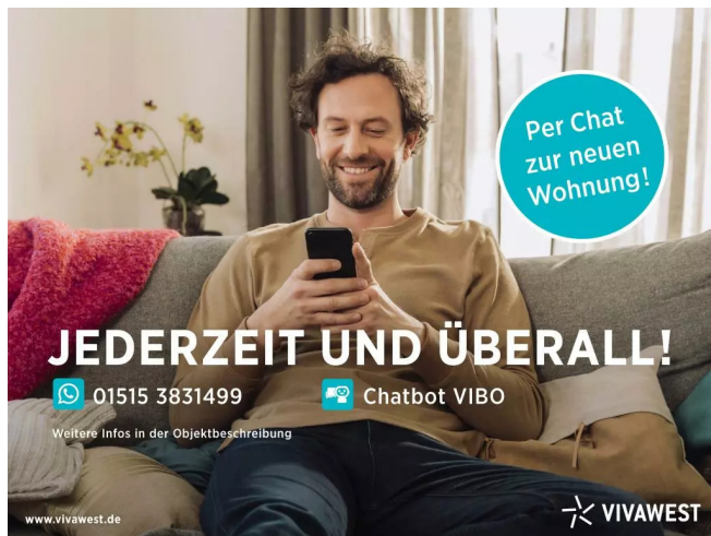
Kontakt per Messenger!